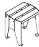
TABOURET / STOOL