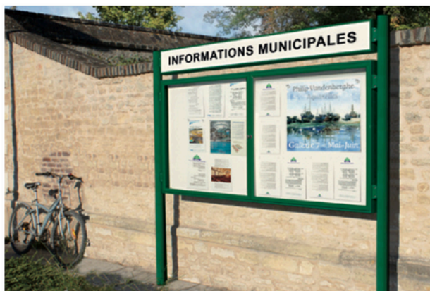
Réf. 414021 + 402917 + 416411*